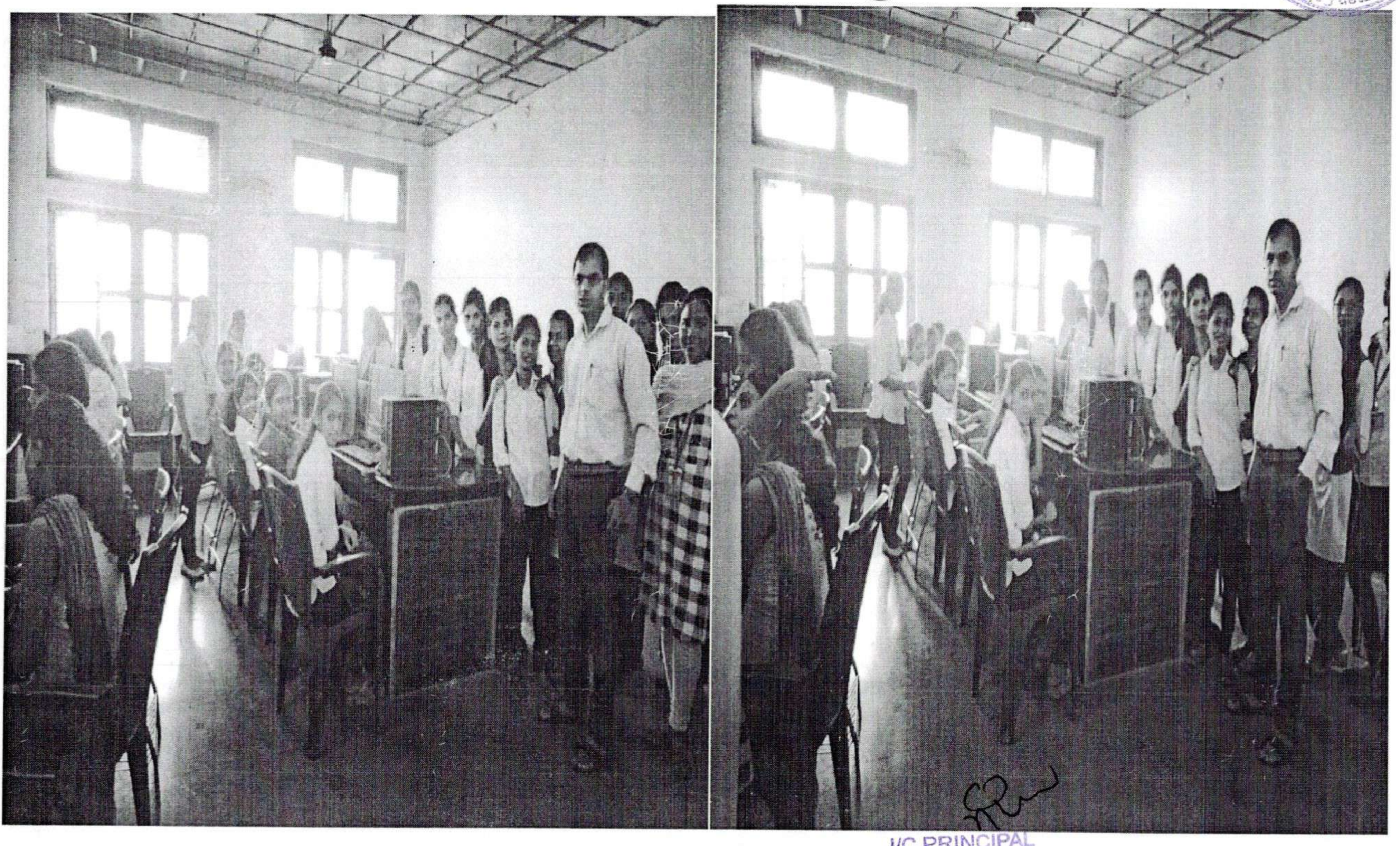
M.B.More Foundation's Art's, Com., Science Women College ALPo.Dhatav, Tal.-Roha, Dist.-Raigad.

Tally, ERP9 With GST Training to the students